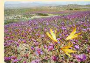
Desierto florido, Región de Atacama.