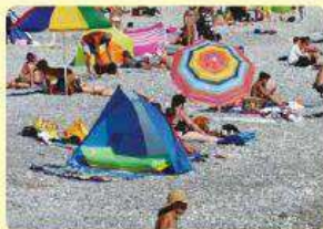
Frutillar, Región de Los Lagos.