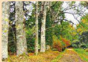
Jardín Botánico Isla Teja, Valdivia